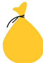
sac jaune tri sélectif