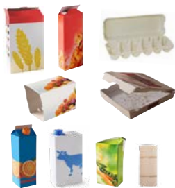
Todo tipo de cartones, cajas de cartón, tetrabriks