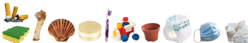
Residuos higiénicos (pañuelos de papel, pañales...), colillas de cigarrillos, envases de madera, restos de comida no consumibles, etc.