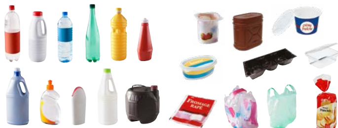
Todos los envases de plástico