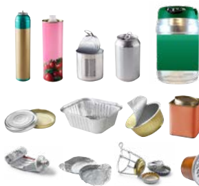
Todos los envases metálicos