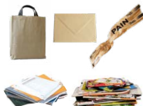
Papel de todo tipo