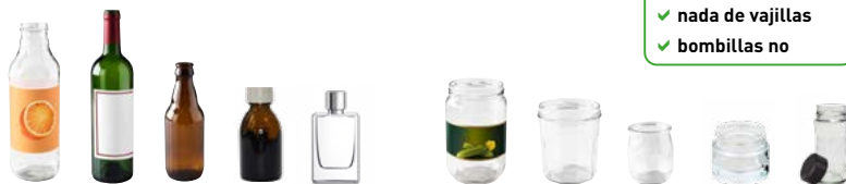
Todos los envases de vidrio, botes, tarros y botellas