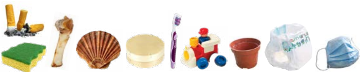
Hygieneartikel, Geschirr, Essensreste, Zigarettenstummel, Kunststoffobjekte (nicht elektrisch)