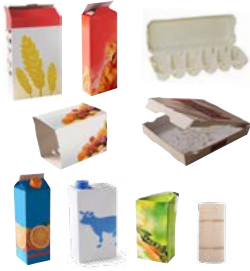
Karton und Tetra Packs