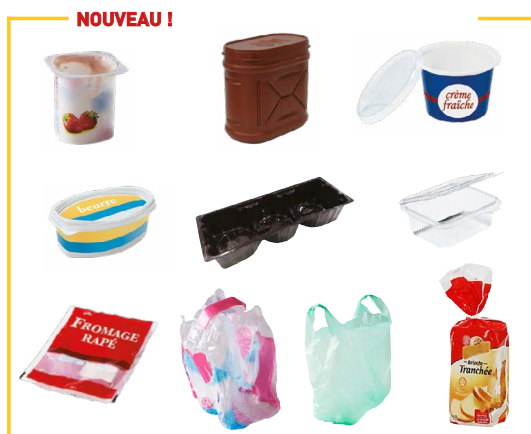
Tous les emballages en plastique