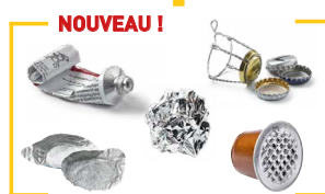
Tous les emballages en métal