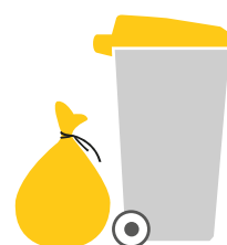
bac ou sac jaune