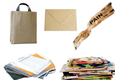
Tous les papiers (sauf : essuie-tout, mouchoirs et papier peint)