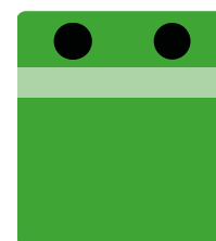
conteneur à verre