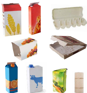
Tous les cartons, cartonnettes et briques alimentaires